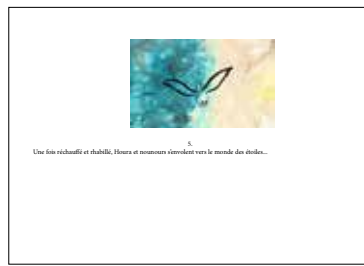
Une planche de kamishibai recto/verso